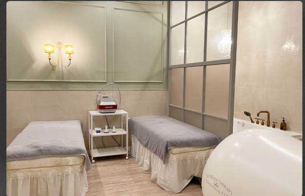
메디컬 스파 Medical Spa