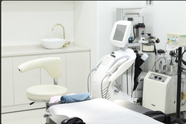
수술실 Operating Room