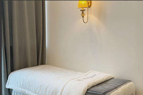
회복실 Recovery Room