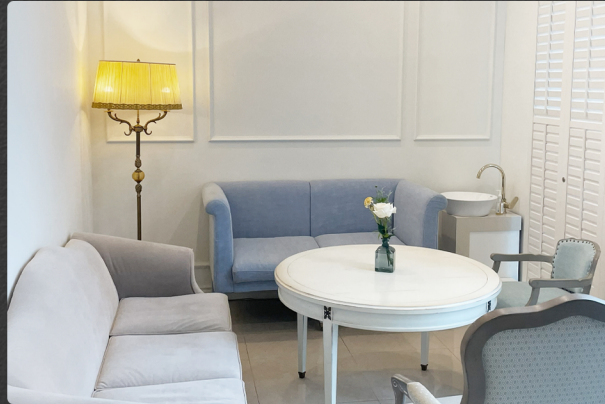
상담실 Consultation Room