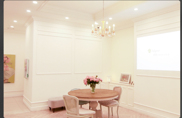
VIP라운지 VIP Lounge